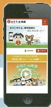
ねんきん太郎 「ねんきんネット」マスコット